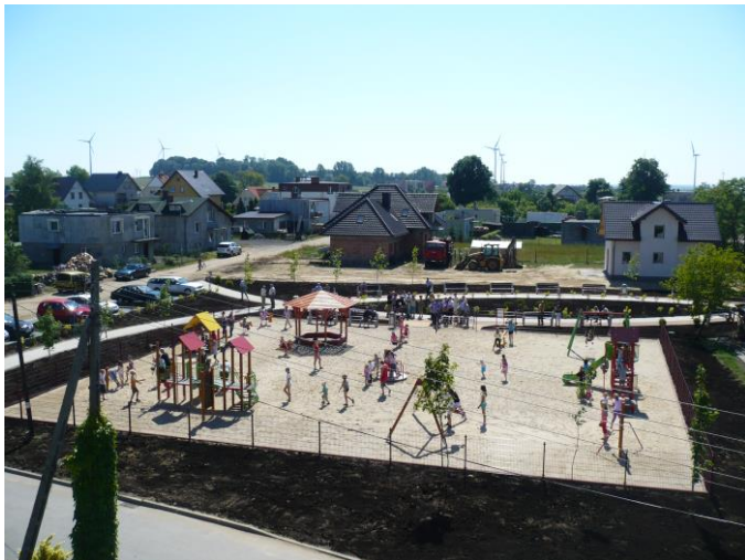
Plac zabaw w Łebczu

nam się wybudować kilka placów zabaw w miejscowościach Strzelno, Łebcz, Rekowo Górne, Brudzewo.