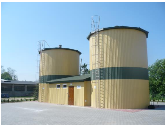
Stacja uzdatniania wody w Mrzezinie

Przebudowaliśmy stację uzdatniania wody w Mrzezinie, której koszt wyniósł 3,3 mln złotych. Obecnie budujemy stację uzdatniania wody w Leśniewie (wartość całkowita to 4,5 mln zł w tym dofinansowanie 1,8 mln zł).