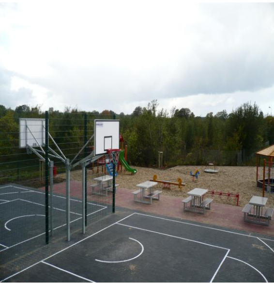
Zagospodarowanie placu na osiedlu słonecznym w Rekowie Górnym