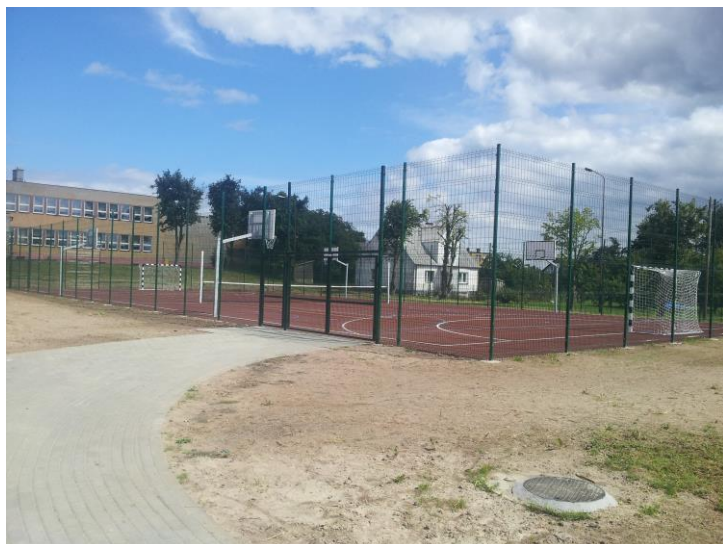
Boisko wielofunkcyjne w Gnieździe

Wybudowaliśmy również boiska wielofunkcyjne w trzech miejscowościach w Domatowie, Gnieździe i Swarzewie.