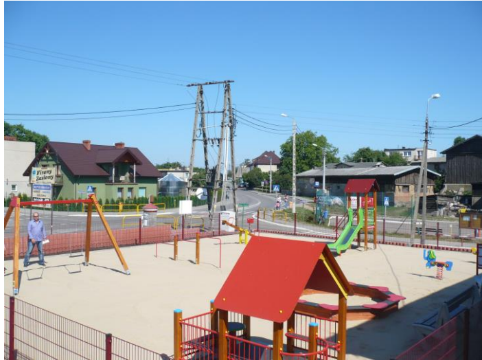
Plac zabaw w Strzelnie