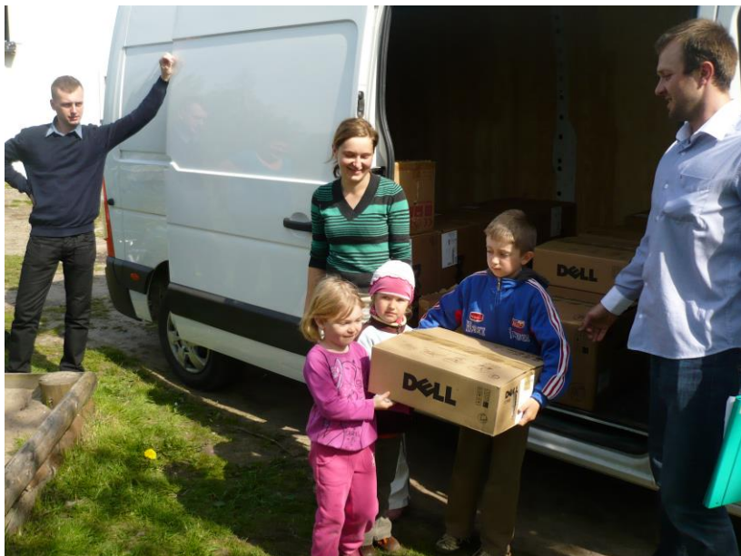
Dostawa komputerów mieszkańcom

zapewnić minimalizację wykluczenia cyfrowego na terenie Gminy Puck. Łącznie pozyskaliśmy na ten cel 3,6 mln zł. Realizacja tych projektów przyczyni się do upowszechnienia dostępu do szerokopasmowego Internetu dla 250 gospodarstw domowych poprzez zapewnienie trwałego dostępu do Internetu i wyposażenie w sprzęt komputerowy.