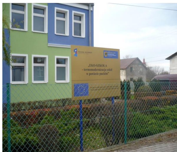
Termomodernizacja szkoły w Łebczu

Obecnie realizujemy dużą inwestycję termomodernizacyjną dofinansowaną ze środków Narodowego Funduszu Ochrony Środowiska i Gospodarki Wodnej w Warszawie. Termomodernizacji poddaliśmy budynek Zespołu Szkół w Żelistrzewie.