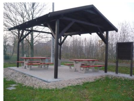
Mała infrastruktura turystyczna Sławutowo

Zagospodarowano także teren wypoczynkowy w Sławutowie. Umieszczono tam wiatę drewnianą, wydzielono miejsce zabaw dla dzieci oraz miejsce na ognisko. W pobliżu miejsca na ognisko oraz pod wiatą usytuowano ławki oraz stoły wolnostojące bez fundamentu.