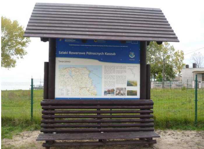
Turystyczny Szlak Północnych Kaszub

W roku 2012 zakończyliśmy realizację projektu „Turystyczny Szlak Północnych Kaszub”. W ramach tego projektu oznakowaliśmy 35 847 metrów szlaków rowerowych: 18 070 metrów szlaku Euro Velo R10 i 17 777 metrów szlaku „Pierścienia Zatoki Puckiej” oraz przebudowaliśmy nawierzchnię drogi gruntowej na odcinku Rzucewo – Bładzikowo (3558 m).