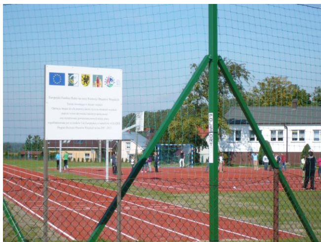
Boisko wielofunkcyjne w Polchowie

Budowa boiska wielofunkcyjnego w Polchowie – inwestycja dofinansowana w ramach Programu Rozwoju Obszarów Wiejskich na lata 2007-2013 (całkowita wartość zadania 553 tys zł w tym dofinansowanie 360 tys zł.).