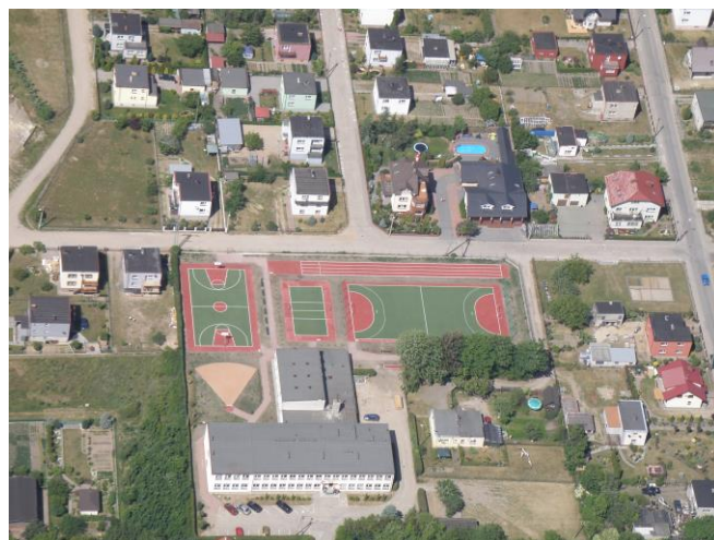
Boisko wielofunkcyjne Mrzezino

W ostatnich latach Gmina Puck zrealizowała szereg inwestycji z zakresu infrastruktury sportowo- rekreacyjnej. Do najważniejszych z nich należą: budowa boiska wielofunkcyjnego w Mrzezynie na które uzyskano dofinansowanie z Ministerstwa Sportu i Turystyki w wysokości 200 tys zł.