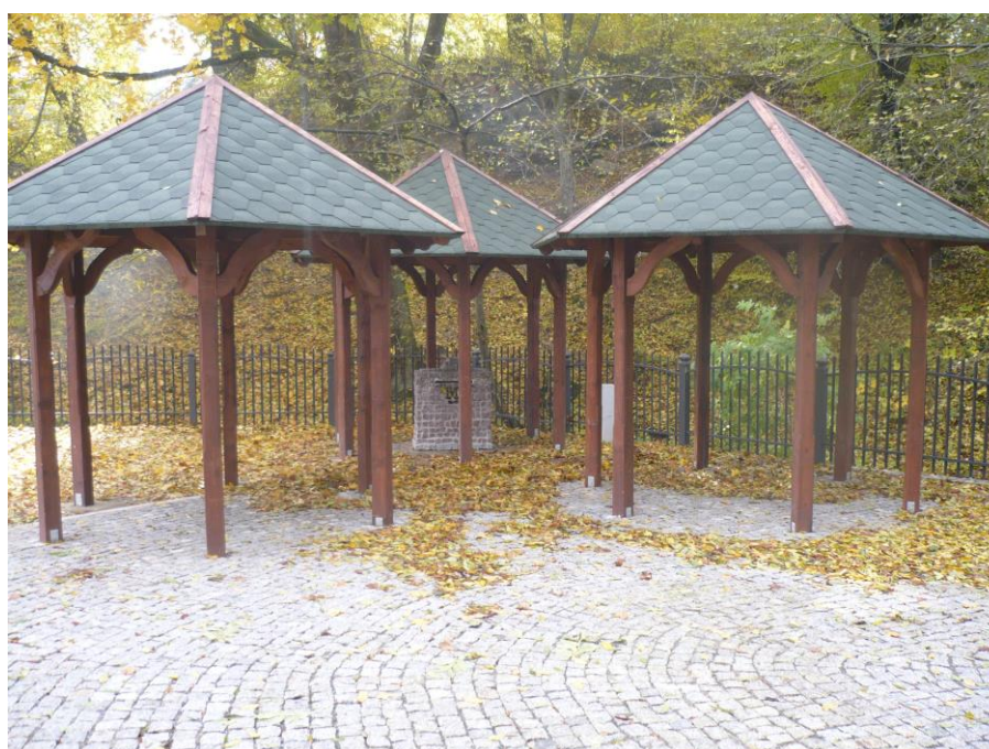
Zagospodarowanie placu przy Grotach Mechowskich

Zagospodarowano plac przy Grotach Mechowskich wraz z budową boiska w Mechowie (całkowita wartość zadania 466 tys zł w tym dofinansowanie 298 tys zł.).